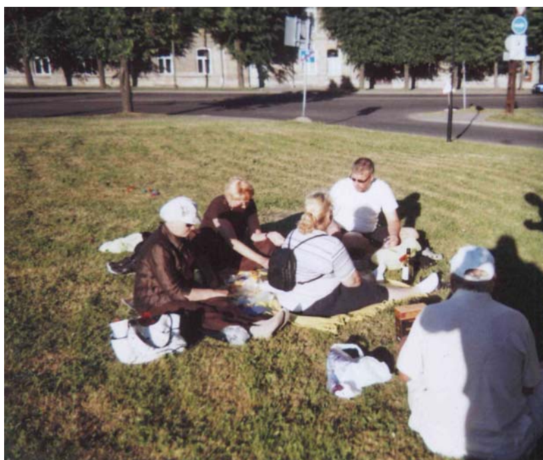
Pyrinnön porukkaa piknikillä